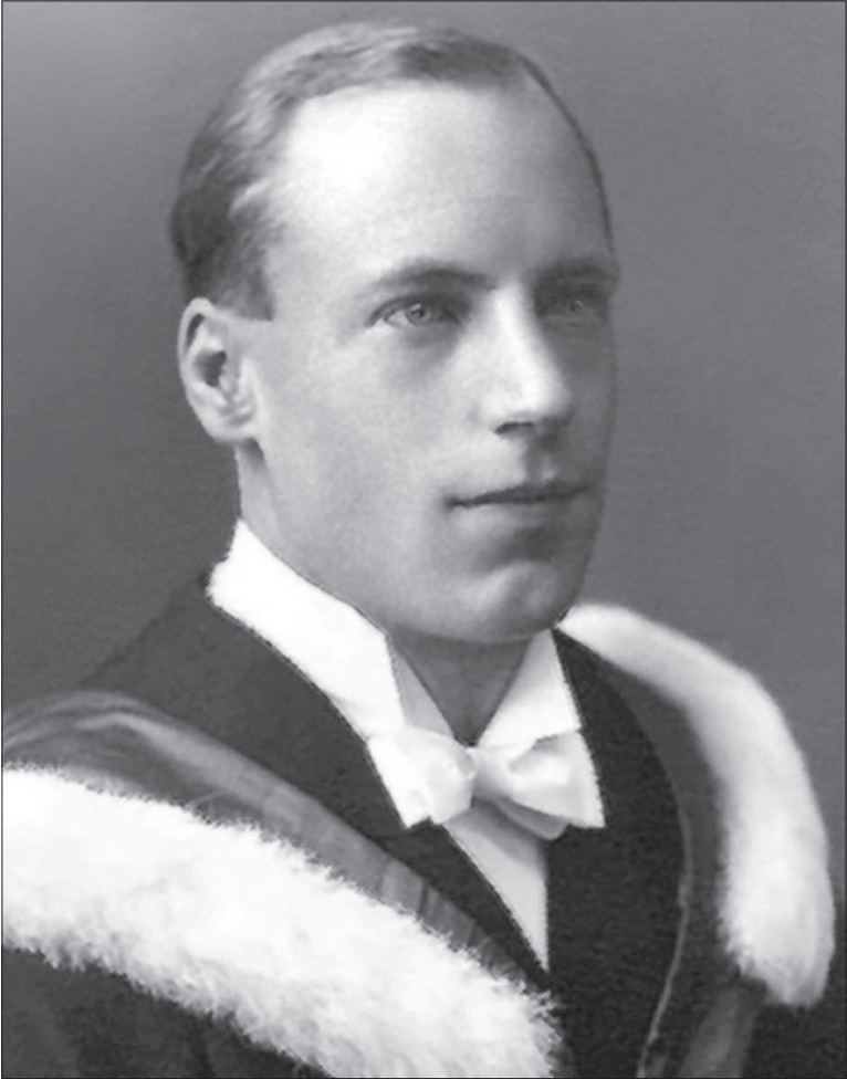
1924 beendete Eric Liddell sein Studium der Naturwissenschaften mit dem Bachelor-Diplom der Universität Edinburgh.