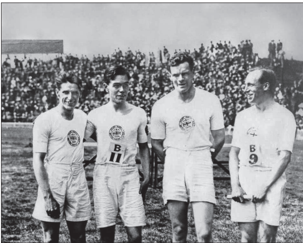
Im Stadion an der Stamford Bridge zusammen mit den anderen Mitgliedern der britischen Staffelmannschaft. Acht Tage nach seinem Olympia-Triumph sicherte Eric Liddell (rechts) mit einer starken Leistung seinem Team den Sieg über die US-Mannschaft (Siegerzeit: 3 Minuten).

Eric sollte der Schlussläufer in der britischen 4 x 400-Meter-Staffelmannschaft sein. Der Schlussläufer im amerikanischen Team war niemand anders als Horatio Fitch, den Eric im 400-Meter-Finale in Paris geschlagen hatte. Jedermann war gespannt, ob Eric Fitch noch einmal schlagen konnte. Die Menschen mussten nicht lange darauf warten.