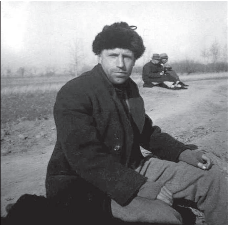
Eric Liddell bei einem Aufenthalt in Siao Chang. Das Foto entstand zu Beginn des Zweiten Weltkriegs während eines seiner Einsätze für Not leidende Chinesen im japanisch besetzten Teil des Landes.

gesprungen waren, konnten die chinesischen Männer gut genug sehen, dass sie sich geirrt hatten. Daraufhin stellten sie das Schießen ein. Nachdem sich die Schützen entschuldigt hatten, fuhren Eric und sein Freund weiter. Während er so dahinfuhr, dachte Eric über das Vorkommnis nach. Mittlerweile war niemand mehr sicher. Bei einer so simplen Angelegenheit wie der Heimfahrt von einer Hochzeit konnte ein Mensch getötet werden. Eric war nur froh, dass die chinesischen Männer so schlechte Schützen waren!