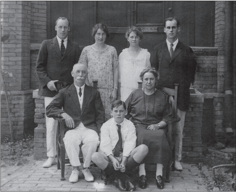
Die Familie Liddell in Beidaihe (China) im Sommer 1925.

folgenden Schuljahr höchstwahrscheinlich keine Schüler in der anglochinesischen Schule geben würde. Alle 500 Schüler waren in den Streik getreten!