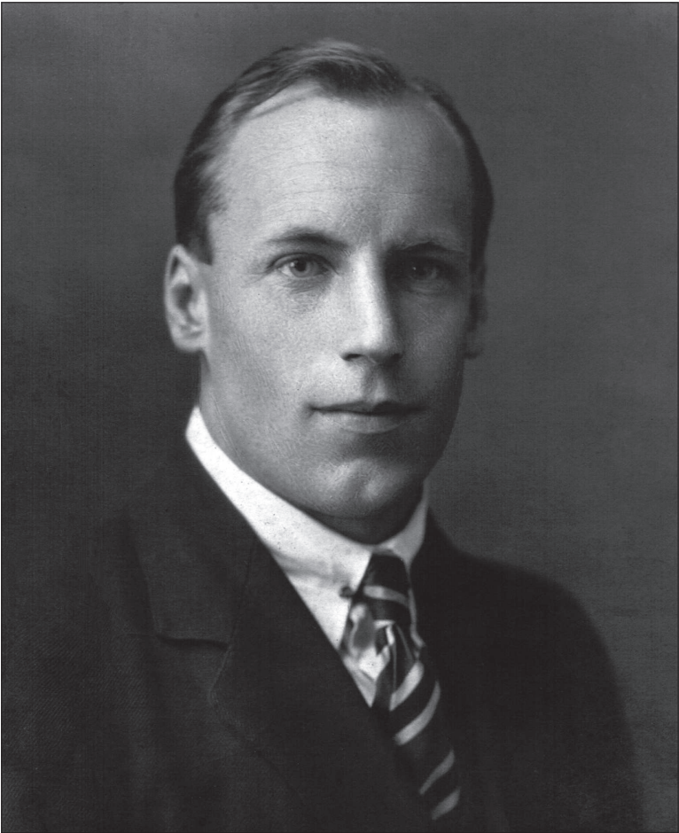
Eric Liddell (Aufnahme aus den 1920er-Jahren).