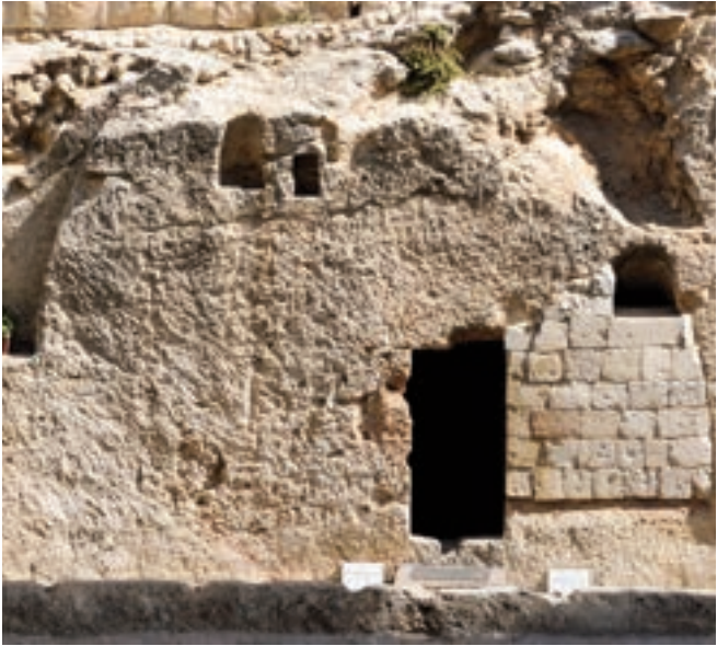
Ein Felsengrab in Jerusalem