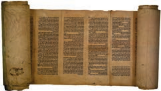
Ausschnitt einer ca. 400 Jahre alten Tora-Rolle

Diese Schreiber waren äußerst akribisch und gewissenhaft. Sie standen in einer Tradition und Verpflichtung. Das bestätigt objektive Wissenschaft ohne Wenn und Aber. So hat Gott über sein Wort gewacht!