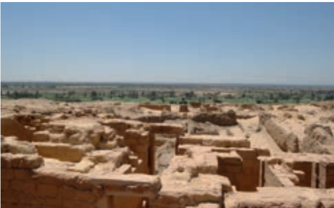
Oasenstadt Fayum (Ausgrabungsstätte); Fundort biblischer Papyri