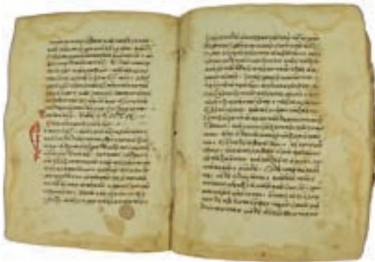
Evangelienhandschrift, um 1450 n. Chr.

also für alle, die behauptet haben oder es noch immer tun, das Johannes-Evangelium sei erst im späten 2. Jahrhundert nach Christus verfasst worden. Ausgrabungen beweisen das Gegenteil.