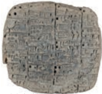
Keilschrifttafel, akkadisch; 2400 v. Chr.

B ei Ausgrabungen in Ägypten und im Nahen Osten wurden die ältesten Inschriften der Welt entdeckt. In Mari (heute Syrien) stieß der Archäologe Parrot auf 23.000 beschriebene Tontafeln.